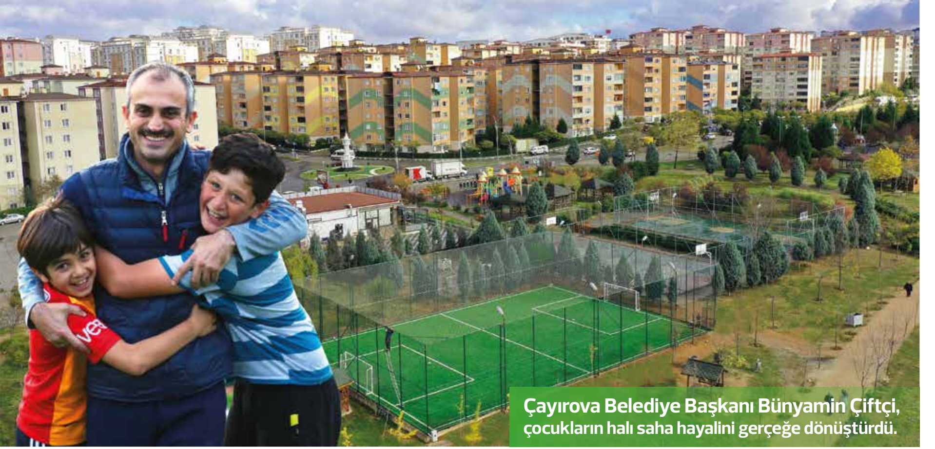
Çayirova Belediye Başkanı Bünyamin Çiftçi, çocukların halı saha hayalini gerçeğe dönüştürdü.